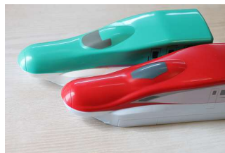
スーパーこまち & はやぶさ