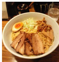
「辛しや あぶらめん」